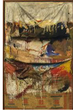
شكل رقم (3)