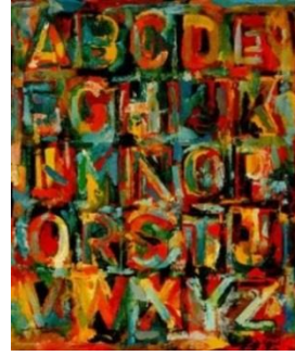
شكل رقم (1)