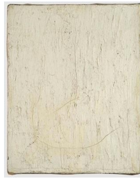
شكل رقم (5)