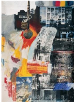
شكل رقم (4)

ومثلما تبدل مفهوم العمل الفني تبدلت مفاهيمه الجمالية وتغيرت، هذا وتمكن البوب آرت حتى هذا اليوم ان يجتاح مجالات التصميم فنجد تأثيره على الديكورات والملابس الحقائق ليصبح بالفعل ثقافة يومية متداولة جمالياً، وهذه المواد بكثرتها ومحدودية ثباتها جعلت من فن البوب آرت فن يمتلك من الحرية المطلقة لاختيار مايناسب موضوعه بانطلاق فكري وتخيلي نحو الحياة. و" تحرر في التعبير رافضاً كل ما هو وجداني أو ذاتي والاهتمامات الخاصة، ليتجه نحو عالم الطبيعة والحياة المعاصرة. كسر الحدود بين الفن والحياة، والتركيز على الشئ العادي، والمبتذل له قدرة جمالية وان كل لحظة في الحياة يجب ان تقدر لذاتها." (محمد، 2015، ص29). كما في الشكلين (3،4)