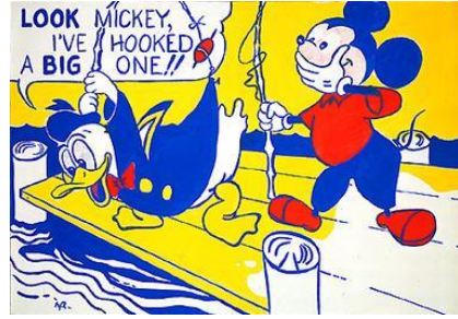
شكل رقم (9)