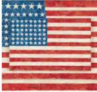
شكل رقم (11)

من هذا العمل يظهر ان جاسبر في استخدامه للاشياء الواقعية قد اخضعها لمنظومته التخيلية وجسدها باشكال تحتاج الى تأويلات عميقة لدلالاتها المفتوحة والتي لاتنتهي الى ماهو صواب او خطأ فالحدس لدى المتلقي يعطيه الحرية الكافية في بناء المعنى.