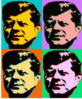
شكل رقم (8)

" بدأ ( أندي وار هول Andy Warhol ) رساماً في مجال الدعاية والإعلانات وانتقل إلى (الفن الصافي) عن طريق الصورة الفوتوغرافية، وذلك وفق طريقة جديدة تعتمد على تكرار النموذج الواحد مرات عدة،... وبتابعه هذا الأسلوب واستخدامه وسائل ميكانيكية آلية في طبع الصور المتتالية (كما هو في قناني الكوكا كولا او صور مارلين مونرو)، إنما أراد أن ينقل إلى العمل الفني ميكانيكية الشعارات الدعائية في الذهن بفضل تكرارها أو الملصقات التي تثير انتباه المارة على الواح الاعلانات وفي هذه الحالة يلجأ الفنان إلى اللونية الشبيهة بلونية الملصق لكن بطريقة تثير انتباه المشاهد الذي يمر امام مثل هذه الاعمال." (الخطاب، 2012، ص194). والموقف الذي اتخذته اندي وار هول من مجتمعه لم يكن حيادي بل اتخذ صيغته النقدية الواضحة اذ " يتمثل امامنا عمل الفنان (اندي وار هول) لشخصية امريكية مشهورة كممثلة اغراء تتمظهر على شكل ينقسم على شطرين ايمن وايسر يحمل كل شطر (25) صورة بورترت ل(مارلين مونرو). يتصف الجانب الايسر بصورة بورترت ملونة خفيفة برتقالية متدرجة من الفاتح إلى الغامق يظهر فيها الوجه بلون وردي والشعر بلون اصفر وربطة الشعر بلون ازرق مع تمثل الظل من جهة واحدة لجميع الصور الملونة. ومن الجهة اليسرى تتمثل باللون الحيادي لنفس الصورة باللون الاسود والابيض مع تمثل الظل من جهة واحدة لجميع الصور الحيادية " كما في شكل (7). (آل وادي، 2011، ص274).