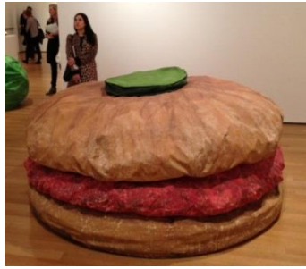
شكل رقم (12)

وان الاستهلاك الانساني المفرط لأي شيء يجعله يصب اهتمامه على شيء ويحيد عن أشياء أخرى، مثلما أراد اندي وارهول إعادة التوازن في الحياة والمساواة الطبقيّة بين افراد المجتمع، اراد اولدنبيرغ إعادة توازن الانسان لنفسه تنبيهه له من استخدامه المفرط لحاجاته في الحياة. وعمله يحمل الكثير من المواعظ والتهويل لأهمية الحد من ذلك الاستهلاك، فقد استعاض بحجم الهمبرغر المبالغ به والذي اخذ مساحة اكثر مما هو مطلوب للتنبيه على سلبيته فقد "اجرى كليس اولدنبيرغ، هو الآخر، تجارب في تأثيرات الاذاحة. ان اشياءه تحول حول عالمي النحت والرسم. وهذه الاشياء تتدرج من اشياء مثل (همبرغرات) عملاقة الى نماذج صدفنة من احواض الغسيل وطارق البيض. وغالبا ما تكون هذه الاشياء منفذة بمادة الفلينيل (الجلد الصناعي) ومحشوة بالالياف. " كما في شكل رقم (12) (سميث، 1995، ص134).