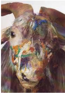
شكل رقم (6)

ومثل تلك العلاقات التشكيلية التي ارادها روشنبيرغ لاستنثاره المتلقي، تعود الى سمات الخطاب الجمالي لفنون ما بعد الحداثة لجعل الاعمال الفنية رسالة منفتحة الدلالات لقارئها على وفق رؤيتهم الخاصة " ففي اوائل الخمسينيات رسم (روشنبيرغ) سلسلة رسوم بيضاء كلها خيالية الا من ظل الناظر نفسه، ثم رسم بعدها سلسلة رسوم سوداء، الا انه لم يكن أي من هذين الامرين تطوراً فريداً اذ كانت هناك ممارسات سابقة، فبعد هذه التجارب بدأ (روشنبيرغ) بالتحرك نحو (الرسم الخليط) الذي مثل نسق ابداعي يخلط فيه السطح المصبوغ مع أشياء متنوعة مثبتة على السطح، وقد تتطور هذه الرسوم الى أشياء ثلاثية الأبعاد بقواعد حرة، ك (المعزة المحشوة) المشهورة التي عرضت في كثير من معارض الفن الامريكي المعاصر. " كما في الشكل رقم (5،6) (القره غولي، د.ت، ص198).