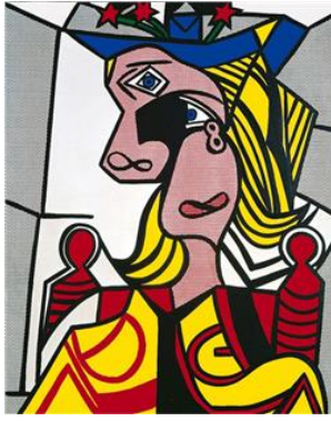
شكل رقم (10)

انه تقبلها لانها موجودة امامه في العالم" كما في شكل رقم(10). (البيسوني، 2001، ص303-304).