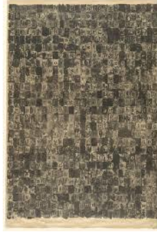
شكل رقم (2)

ان "التحول من الحداثة الى ما بعد الحداثة في الفن التشكيلي... تم فيه القضاء على الجمالية الموروثة والمرتبطة بفكرة الشكلانية، واحل محلها واقع جديد للعمل الفني يستمد جماليته وقيمه من المجتمع" (الخطاب، 2012، ص148)، وهذا ما ينطبق على الخطاب الجمالي اذ تغير في آلية إرساله ايضا، لأنه يخص تلك المدارس الفنية التي ظهرت معاصرة لانتشاره ومتأثرة به فهذه الفنون غريبة في معناها ومختلفة بأسلوبها، تكسر النمطية، وتعتمد الاثارة. " حيث تعد لغة الخطاب الجمالي البصري ممثلا بفن الرسم الأوربي منه خاصة ذات التنظيمات والتفكيكات النصية بنزوعاتها التمردية على عالم العقل لتحمل فضاءات اللعب الحر واللانسقية وبالعبث والعدمية واللاتطابق وتعليق الحكم وتهشيم المركزي وتقويض المعنى وتأكيد حيثيات الواقع...فالحقيقة تكمن في التأويل ذاته عبر جدلية نص الخطاب الجمالي في محاوره الأخر وباللاتطابق والارتكان إلى سلطة الثابت من الدلالات. فحيوية الخطاب الجمالي تكمن في حيوية احوالاته الدلالية والتأويلية بمدياتها العدمية." (الدليبي، 2013، ص118). ينظر الى الشكلين (2،1)